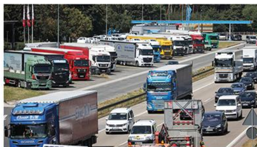
Mit der LKW-Schnauze voll im Lärm und Dreck kann bald ein Bild der Vergangenheit sein...

begrünt werden. Dabei würden Kletterpflanzen in Tröge gepflanzt die am Boden stehen und dort auch bewässert. Dies könnte von dem Reinigungspersonal das sowieso die WC Anlagen betreut, mit übernommen werden. Die offenen Seitenflächen werden dabei mit Stahlseilen "vergittert" damit die Pflanzen hochwachsen können.